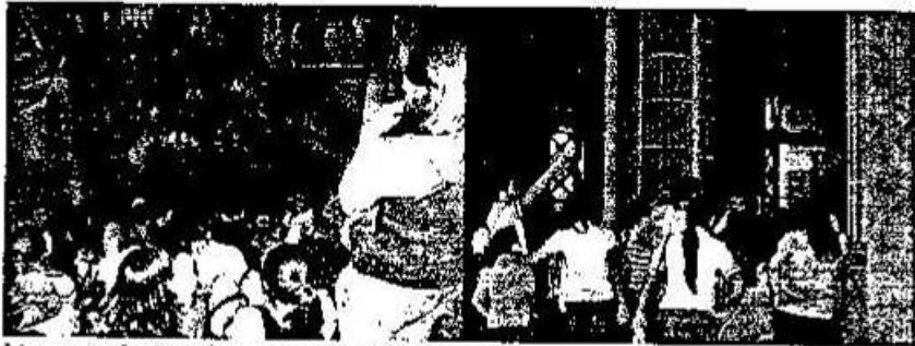
lizeo profesional en computación, zona 1